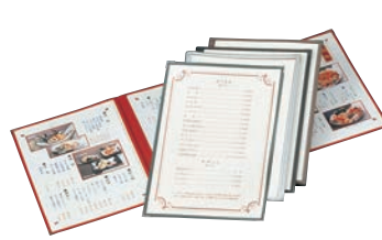
⑭ えいむ クリアテピング メニューブック TA-46 ㊦