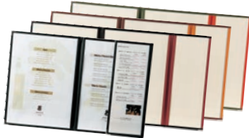
⑨ えいむ クリアテピング メニューブック LTA-46S ㊦