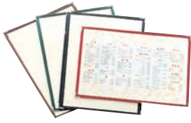
① えいむ クリアテピング メニューブック LTA-42 ㊦