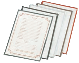
⑮ えいむ クリアテピング メニューブック TA-48 ㊦