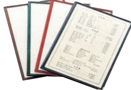
③ えいむ クリアテピング メニューブック LTA-44 ㊦