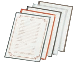
⑬ えいむ クリアテピング メニューブック TA-44 ㊦