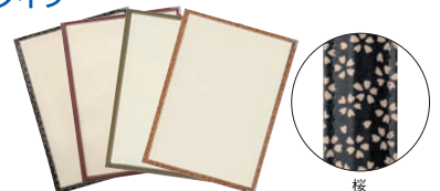
⑪ えいむ PP布地クリアテピング メニューブック PTA-441 ㊦