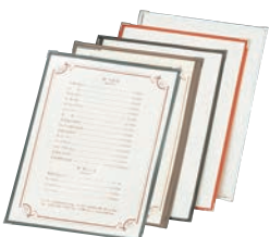
⑫ えいむ クリアテピング メニューブック TA-42 ㊦