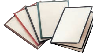
⑤ えいむ クリアテピング メニューブック LTA-46 ㊦