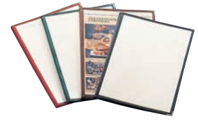
⑦ えいむ クリアテピング メニューブック LTA-48 ㊦