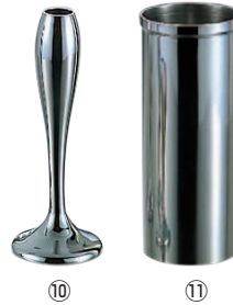
⑩SW 18-8 丸 フラワースタンド