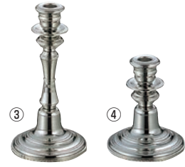
UK 18-8 V型 キャンドルスティック 1本立