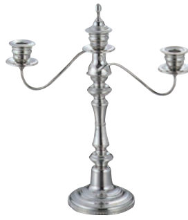
②UK 18-8 V型 キャンドルスタンド 3本立