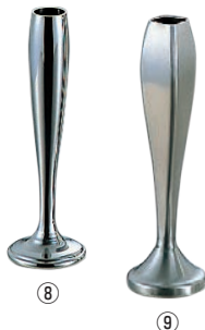
⑧UK 18-8 砲弾型 フラワースタンド