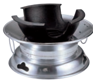
⑤アルミM式水コンロ