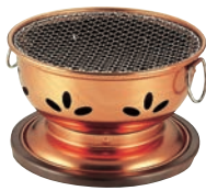
②アルミ炭火コンロ炭火亭