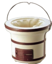
⑪つる付木炭コンロ