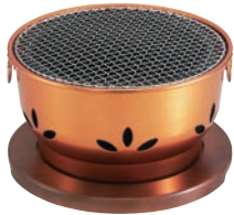
①アルミ炭火コンロ ジャンボ炭火亭