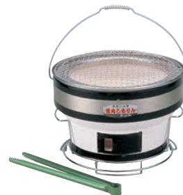
⑭焼肉しちりん台付