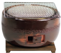
⑧三河コンロ大型(茶)