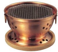
④銅水コンロ(木台アミ付)