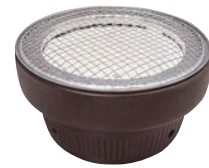
⑦三河水こんろすみ丸こげ茶