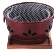
③アルミ炭火コンロニュー炭火亭