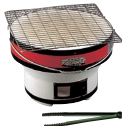
⑬炭用バーベキューコンロ丸型