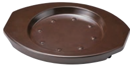
⑮耐熱樹脂 グリル台 ブラウン ㊦

ページコード 商品コード 価格 M11-525 4-1747-1501 7609400 180×235×H22 底内径:φ130 材質:ポリプロピレン 耐熱温度:200℃ ※⑪～⑬専用です。