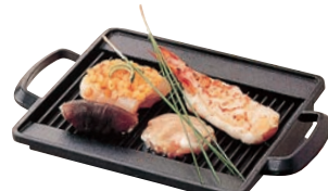
⑳焼物プレート さざ波 ㊦

ページコード 商品コード 価格 M10-577 4-1747-1901 8262900 φ180×H30 ●コンロセットにセット可能です。 ●フッ素3層コートでこげつきにくく洗い落としが楽です。 ●コンロセットはP1748-22小をお使いください。