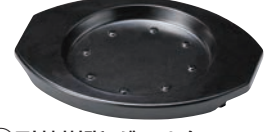
⑭耐熱樹脂 グリル台 ブラック ㊦

ページコード 商品コード 価格 M11-509 4-1747-1301 7609200 φ170×H30 材質:アルミとステンレスの2層 ※専用グリル台は⑬⑭をお使いください。