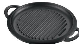
㉑IK ミニグリルプレート ㊦

ページコード 商品コード 価格 M10-549 4-1747-2001 8263000 220×150×H25 ●フッ素3層コーティングによりこげつきにくく洗い落としが楽です。