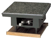
①石焼調理器 百万石 ㊦

ページコード 商品コード 価格 4-1747-0101 3289800 ¥44,000 石板寸法:220×220×H12 全高:140