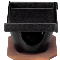
⑩SN 角型 卓上焼ミニ皿セット ㊦

ページコード 商品コード 価格 4-1747-0901 5240100 ¥2,500 φ130×H30 ※六角型(⑥)、片口(⑦)、丸型グリル(⑧)の鍋に使えます。