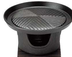
⑰アサヒ スタミナ コンロセット ㊦

ページコード 商品コード 価格 D502-40 4-1747-1601 6995500 鉄皿:φ150×H13 コンロ:φ125×H90