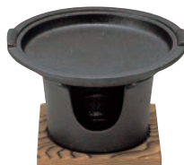
⑯アサヒ 炉ばた コンロセット ㊦

ページコード 商品コード 価格 M11-525 4-1747-1501 7609400 180×235×H22 底内径:φ130 材質:ポリプロピレン 耐熱温度:200℃ ※⑪～⑬専用です。