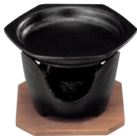
⑥SN 六角型 卓上焼ミニ皿セット ㊦

ページコード 商品コード 価格 4-1747-0601 5239700 ¥5,300 鉄皿:150×21 コンロ:φ120×H85 ※蓋は⑨をお使いください。