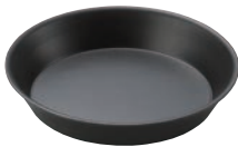
⑪丸型グリル鍋 17cm ㊦

ページコード 商品コード 価格 M11-507 4-1747-1101 7609000 φ170×H30 材質:アルミとステンレスの2層 ※専用グリル台は⑬⑭をお使いください。