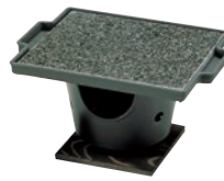
③石焼調理器 十万石 ㊦

ページコード 商品コード 価格 4-1747-0201 3289900 ¥19,800 石板寸法:220×220×H12