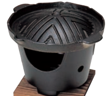
⑱アルミ ジンギスカン 鍋セット ㊦

ページコード 商品コード 価格 D505-514 4-1747-1701 6995400 鉄皿:φ195×H13 コンロ:φ125×H90