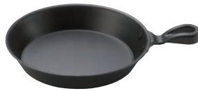
⑫丸型グリル鍋 17cm 片手 ㊦

ページコード 商品コード 価格 M11-507 4-1747-1101 7609000 φ170×H30 材質:アルミとステンレスの2層 ※専用グリル台は⑬⑭をお使いください。