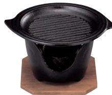
⑧SN 丸型 グリル 卓上焼ミニ皿セット ㊦

ページコード 商品コード 価格 4-1747-0701 5239800 ¥5,300 鉄皿:140×28 コンロ:φ120×H85 ※蓋は⑨をお使いください。