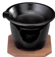
⑦SN 片口 卓上焼ミニ皿セット ㊦

ページコード 商品コード 価格 4-1747-0601 5239700 ¥5,300 鉄皿:150×21 コンロ:φ120×H85 ※蓋は⑨をお使いください。