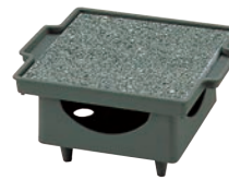
④石焼調理器 五万石 ㊦

ページコード 商品コード 価格 4-1747-0301 3290000 ¥11,800 石板寸法:180×150×H8 全高:100