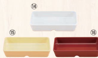
スクエアパーツ・ポーション 2/9 M-2392