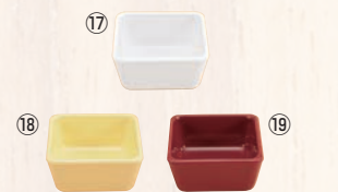
スクエアパーツ・ポーション 1/9 M-2391