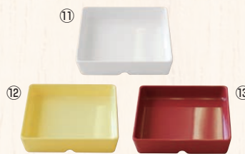
スクエアパーツ・ポーション 4/9 M-2394