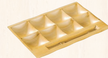
④ 「和」 テイスト ビュッフェプレート 白木(刷毛目)