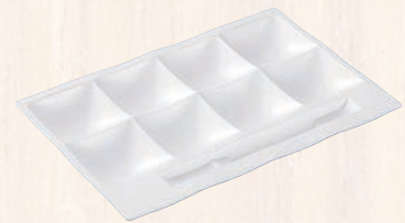
① 「和」 テイスト ビュッフェプレート 陶磁器調 (スーパーハード塗り)