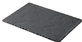
②バサルト レクタンギュラープレート