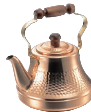
⑦銅クラッシーケトル 容量 ページコード 外径 口径 深さ 商品コード 価格 2.0ℓ 4-1287-0701 195 85 155 8034800 ¥16,700 2.5ℓ 4-1287-0702 195 85 170 8034900 ¥17,400