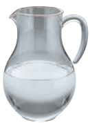
⑥UK アクリル ウォーターピッチャー AYC1BPT-1