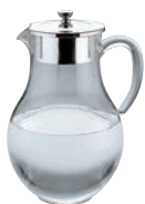
①UK アクリル ウォーターピッチャー