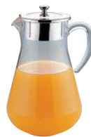
⑧UK P.C. ウォーターポット