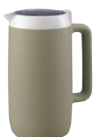
象印 クールピッチャー DGB-17C