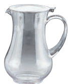
②UK ウォーターピッチャー ステンリッド