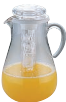
⑩UK アクリル ウォーターピッチャー AYC5APC-1