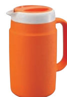
タイガー 保冷ピッチャー PPB-A170