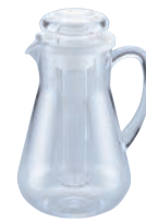
⑨UK P.C. ウォーターポット 1.75ℓ (蓋付)