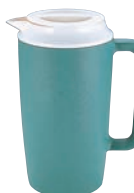
UK PCダブルウォーターポット