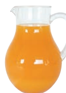
⑫ Baron ジュースピッチャー