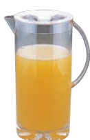
⑪UK メタクリル ウォーターピッチャー