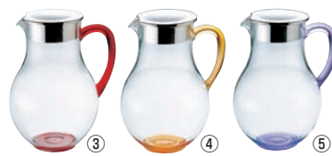
UK ウォーターピッチャー (蓋付) 2.2ℓ