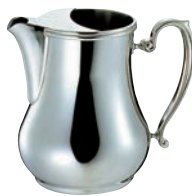
⑥SW 18-8 ビクトリア ウォーターポット (アイスガード付)