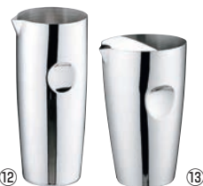
UK 18-8 ウォーターピッチャー