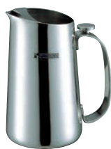
⑤18-8 リッチ ウォーターピッチャー RC-02 52