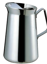
⑦SW 18-8 ET型 ウォーターポット (アイスガード付)