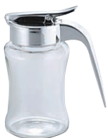
⑮ ガラス スリム ハニージャー ㊦