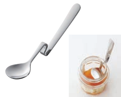
⑰ 18-8 ハニースプーン 縦型 ㊦