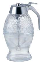
⑯ ガラス ハニーディスペンサー ㊦