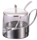
② ガラス シュガーポット No.8078 ㊦