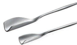
⑭ くるりとハチミツスプーン ㊦