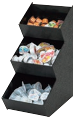
⑬ ポーションオーガナイザー 3段 ㊦