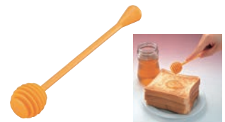
⑲ ハチミツスプーン ㊦