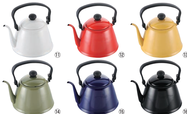
ホロー ドリップケトルⅡ DK-200