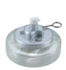
④ ヒートエースα デラックス ロータイプ