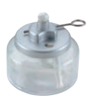
③ ヒートエースα デラックス 6H