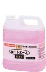
⑥ ヒートエースマックス 詰替専用 液体燃料 4ℓ