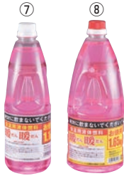
暖暖 (保温用液体燃料)