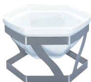
⑥EBM 18-8 バンケット スタンド RY サラダボール用