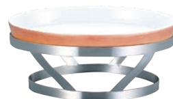
②EBM 18-8 バンケット スタンド 小判型