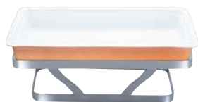
①EBM 18-8 バンケット スタンド 角型