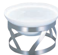
⑤EBM 18-8 バンケット スタンド BW サラダボール用