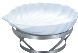
④EBM 18-8 バンケット スタンド 丸型