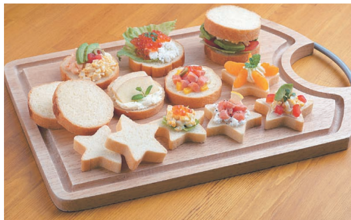
⑦ラ・カナッペメーカー保存容器付 No.2268 ㊦