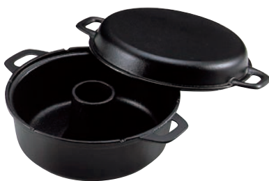
①南部 鉄イモノ パン焼器 ㊦