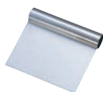
⑬T 18-0 スケッパー