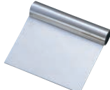
⑭R 18-0 スケッパー