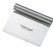
⑰18-0 目盛付 スケッパー No.465