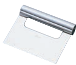
⑱18-0 スケッパー No.452