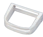
⑳PC柄 パイブレンダー No.547