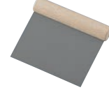
⑯ブラックフィギュア スケッパー