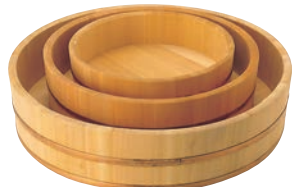
60cm×66cm×78cm×90cmはネジリ止めにあります。