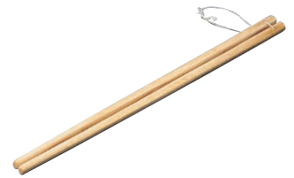
⑩竹製 麵箸 26-206