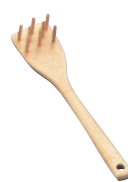
⑮竹製 うどんすくい