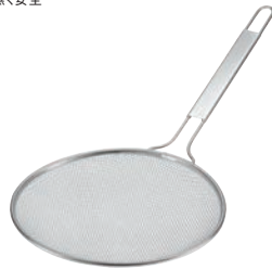
④TS 18-8 共柄すくい網 30cm