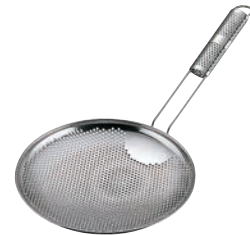
⑥UK 18-8 パンチング 背油こし