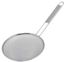
⑦TS 18-8 背油こし

「握りやすく」「滑りにくい」仕上り 麺の水切りはもちろんラーメンに入れる豚の背油切りにもご使用できます。