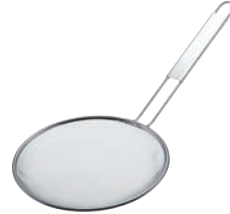
⑨TS 18-8 ラーメンスープこし 極細目