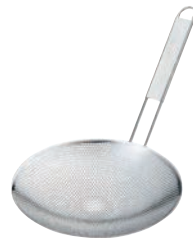
⑤UK 18-8 パンチング 背油こし 23cm