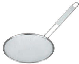
⑧TS 18-8 ラーメンスープこし