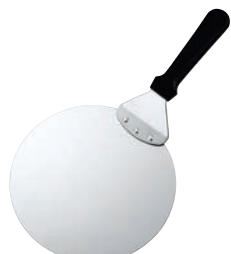
⑨UK ステンレス ピザサーバー PPハンドル

ケーキキャリーとしても使えます。 ケーキを載せてぐらつかず、しっかり運べます。板厚を薄くしてありますので、ケーキの下に入れてやすく抜きやすい。