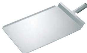
⑪アルミ ピザ用スコップ