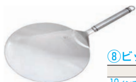
⑧ピックピザサーバー