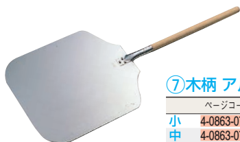
⑦木柄 アルミ ピザサーバー