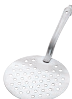
⑩UK 18-8 ピザサーバー