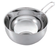
③ TS 18-8 かきまぜボール 13cm ㊦

●目盛付 大目盛:500cc・1,000cc・1,500cc 中目盛:300cc・600cc・1,000cc 小目盛:200cc・400cc・600cc