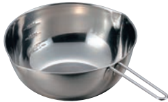
④ 18-8 手付ボール (口付目盛付)