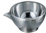
⑥ 18-8 片口 ボール