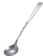
⑬ 18-0 お好み焼用 ネジレスプーン