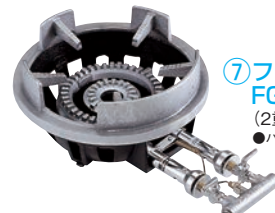
⑦フラッシュ ガスコンロ FG-4型 ㊦ (2重バーナー) 特立ゴク専用 ●パイロット(種火付)