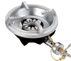
④フラッシュ ガスコンロ FG-1型 ㊦ (1重バーナー、平型ゴク) ●パイロット(種火付) ※平型ゴクのみ仕様です。