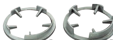
⑨TG・FG 兼用 立型ゴク ㊦ ㊦A