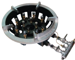
②ガスコンロ TG型 ㊦ ●パイロット(種火付) ※ご注文の際は、平型と立型のゴクが ございますのでご指定ください。