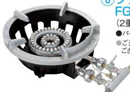
⑥フラッシュ ガスコンロ FG-3型 ㊦ (2重バーナー、平型ゴク) ●パイロット(種火付) ※ご注文の際は、平型と立型のゴクが ございますのでご指定ください。