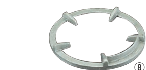
⑧TG・FG 兼用 平型ゴク ㊦ ㊦A