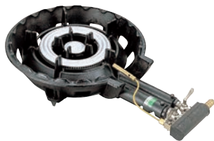
①ガスコンロ SG-2 ㊦ (2重バーナー) ●パイロット(種火付)