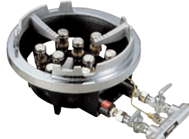
③ジャンボ ガスコンロ TG型 ㊦ ●パイロット(種火付) ※立型ゴクのみ仕様です。 ※TG-15は特立ゴクのみになります。 (㊦のゴク参照)