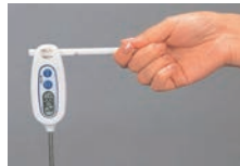
センサーホルダーは持ち手にもなります

5色のカラーバリエーションを用意していますので、使用区域や調理する食材毎に色分けをすることができます。