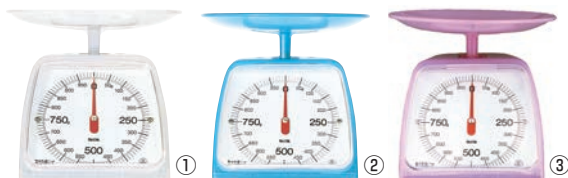
タニタ クッキングスケール 1kg KA-001 ㊦