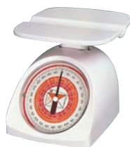
⑩タニタ レタースケール ㊦