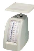
⑪ヤマト セレクター レタースケール ㊦