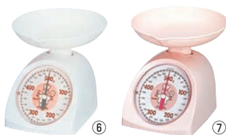
タニタ ベーキングスケール 「コックさん」500g No.1345 ㊦