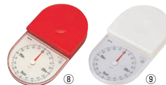
クッキングスケール タニペティ 1kg No.1445 ㊦

176×180×H210 受皿:φ180×H30 ●お菓子づくり専門のスケールです。