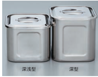
※深型P639-②と比べています。