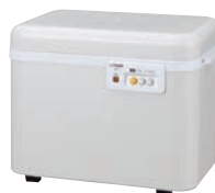
②タイガー 餅つき機 かじまん