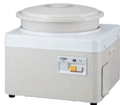
①タイガー 餅つき機 かじまん