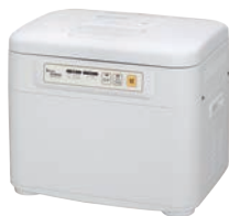
③マイコン餅つき機 かがみもち