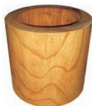
⑩手造り天然ケヤキ oushi