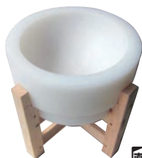
⑤プラスチック餅臼 (木台付)