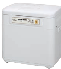
④マイコン餅つき機 かがみもち