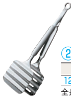
② アスパラガストング ㊦