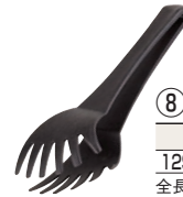
⑧ スパゲティトング 洗