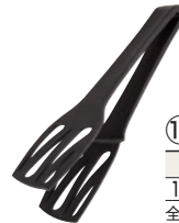
⑩ パン&ケーキトング(穴明) 洗