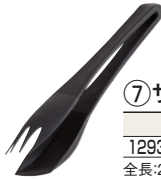
⑦ サービストング 洗