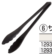
⑥ サラダトング 洗

離型性に優れ汚れが付きにくく作業性抜群 ノンスティックコート加工の調理器具にお薦め