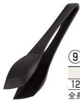
⑨ パン&ケーキトング 洗