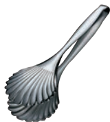
⑩ 18-10 シェル型 ブレードトング