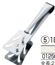
⑤ 18-10 トーストトング