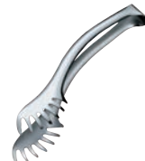
⑪ 18-10 バッフェ スパゲティトング