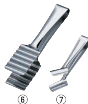
18-10 アスパラガストング