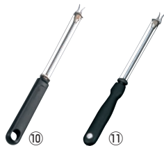
⑩ ウェストマーク チーズスライサー