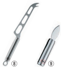
⑧ レズレー 18-10 チーズナイフ