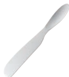
⑰ 手の熱で溶かして切れる バターナイフ