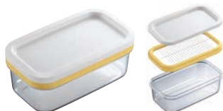
⑭ カットできちゃうバターケース

外寸:230×100×H20 ●ずつと押しで40個にカットできます。 ●200gのバターなら切れ約5gになるので、お菓子やパンづくりの分量の目安にもなります。