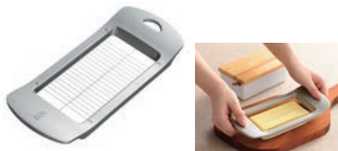
⑬ ワイヤーでスツット切れる バターカッター