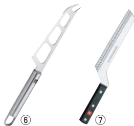
⑥ ツウィリング Pro チーズナイフ