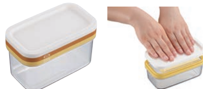
⑮ バターカッティングケース

外寸:165×95×H68 材質:蓋/ポリエチレン ワイヤープレート枠/ABS樹脂 ケース/AS樹脂 ワイヤー/18-8ステンレス ●蓋を押すだけで手を汚さずに、バターを約5gに薄切りカットできます。 ●カットしたバターは、そのまま冷蔵庫にストックできます。