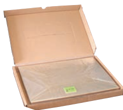
⑱ チーズ用セロファン

全長:151 材質:アルミニウム合金 ●先端部は熱が伝わりやすく、堅いバターにスムーズに入っていくよう1mmになっています。