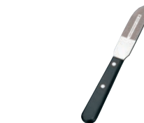
⑫ ヴォストフ バタースプレッ タナイフ