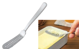
⑯ 18-8 とろける! バターナイフ

外寸:167×95×H102 材質:蓋/ポリエチレン ワイヤープレート枠/ABS樹脂 ケース/AS樹脂 ワイヤー/18-8ステンレス ●蓋を押すだけで手を汚さずに、450gのバターを10gのブロックにカットできます。 ●カットしたバターは、そのまま冷蔵庫にストックできます。