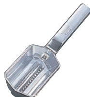
⑮ウエストマーク スケールスキナー (ウロコ取) ㊦