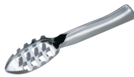
⑨うろこ取り(カバー付) ㊦