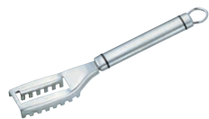
⑩18-8 うろこ取り (9981-518) ㊦