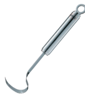
⑯レスレー うろこ取り ㊦