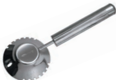
⑪18-8 うろこ取り 銀鱗 ㊦