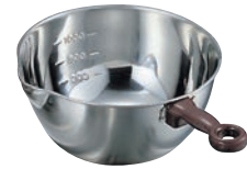
⑨ 18-8 目盛付 手付 片口 ボール