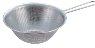
② 手付き パンチングストレーナー 91

●用途に応じ、小(13cm・16cm・19cm)はあまりご様に底が絞ってあり、中(23cm)はミキシングしやすい様に深めに曲線が工夫され、大(27cm)は洗い桶にも使える様大きめになっています。