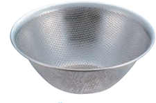
③ パンチングストレーナー 91

●パンチングストレーナーは、ステンレスボールと組合せて使えるようにサイズを設定してあります。 ※13cmのボールに合うストレーナーはありません。