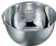
⑩ 18-8 目盛付 片口 ボール

●目盛付 小目盛:200cc・400cc・600cc 中目盛:300cc・600cc・1,000cc 大目盛:500cc・1,000cc・1,500cc