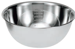
④ シェフズボール ステンレス深型ボール (目盛付)

●パンチングストレーナーは、ステンレスボールと組合せて使えるようにサイズを設定してあります。 ※13cmのボールに合うストレーナーはありません。