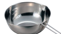
⑫ 18-8 手付ボール (口付目盛付)