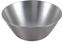
① ステンレスボール 91