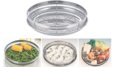
⑥ 18-8 浅ザル&トレーセット