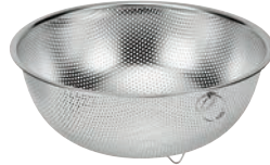
⑤ シェフズボール ステンレス足付パンチングボール (リング付)