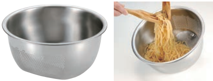
⑦ 3WAY 水切りボール

材質/網/18-8ステンレス 枠・トレー/18-0ステンレス ●漬、野菜の水きりや鍋もの等の、材料の盛り付けに最適です。