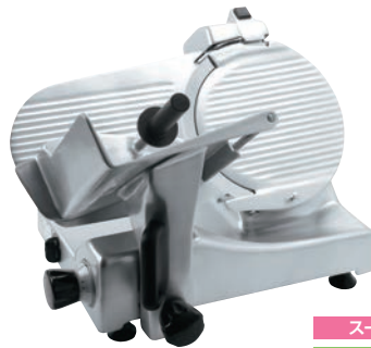
スーパー 焼肉店、しゃぶしゃぶ店