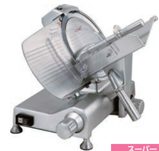
スーパー 焼肉店、しゃぶしゃぶ店