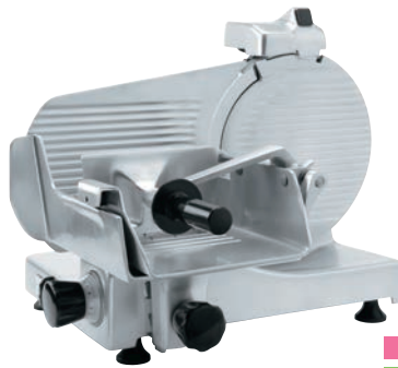
スーパー 焼肉店、しゃぶしゃぶ店