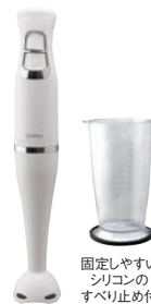
固定しやすいシリコンのすべり止め付

材質: 本体 / ABS樹脂 ブレンダー / ABS樹脂、ステンレス 専用カップ / AS樹脂、シリコン 付属品: 専用カップ (700ml) ●手の小さな方でもしっかり握れます。