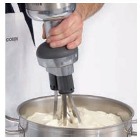
ホイップクリーム