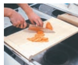
48cmモデルは、シンクに流して使う事が出来ます