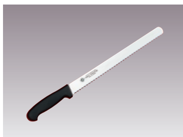
③グランドシェフ PC柄ウェーブナイフ