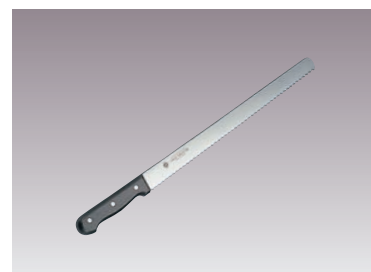
④グランドシェフ ウェーブナイフ