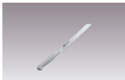
⑥ブライトM11PRO ブレッドナイフ