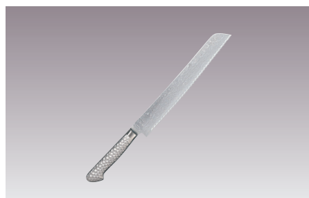
⑧響十 ブレッドナイフ 両