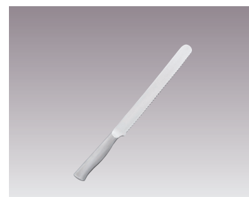
⑩柳宗理 ブレッドナイフ