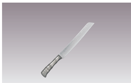
⑨響十 ブレッドナイフ 両