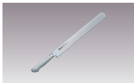
⑤ブライトM11PRO ウェーブナイフ(パン切)