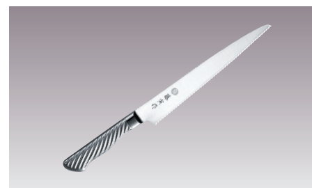
⑦藤寅作 パンスライサー