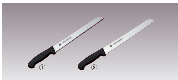
堺 孝行 PC柄