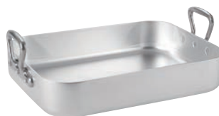
⑤ ムヴィエール アルミ ロティール 1113