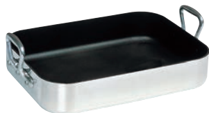
④ ムヴィエール シルバーストーン ロティール 9850