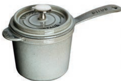
⑪スープポット (グレー)