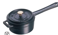
ミニ・ソースパン 10cm