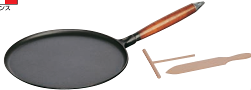
①クレープパン 木柄