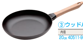
③ウッドハンドル フライパン