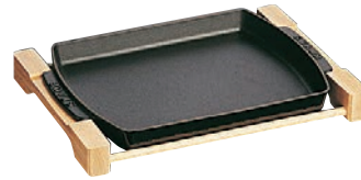
④ステーキプレート