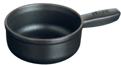
⑨アヒージョポット 12cm