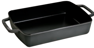
⑤スモールベーカー

本体サイズ:内寸263×202×H20 外寸272×210×H28 木枠サイズ:外寸325×225×H37 重量:2.0kg ●木枠に乗せて卓上ヘサービス