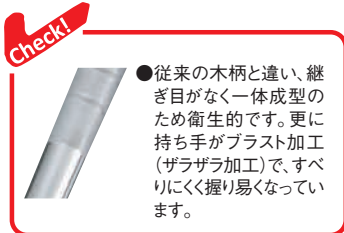
③EBM オールステンレス プラスト加工 中華ヘラ