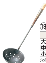
⑲鉄 穴明 中華お玉