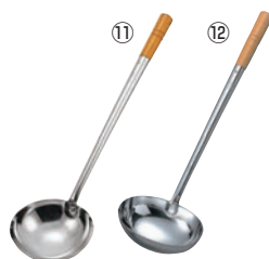
⑪MA ステンレス 中華お玉