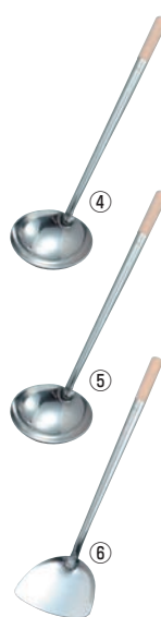
④EBM ステンレス 中華お玉