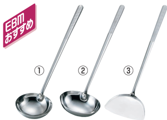
①EBM オールステンレス プラスト加工 中華お玉