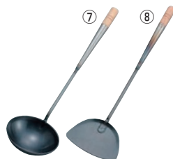
⑦EBM 鉄 中華お玉