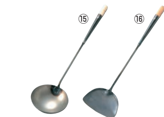
⑮鉄 つなぎ柄 中華お玉