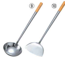
⑨リス 18-0 木柄 中華お玉