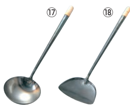
⑰鉄 パイプ柄 中華お玉