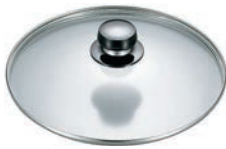
⑤エレックマスターライト用 ガラス蓋