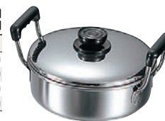
⑨MA 18-0 浅型 ソースポット