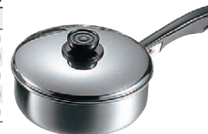
⑪MA 18-0 浅型 ソースパン