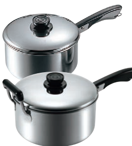
⑩MA 18-0 深型 ソースパン