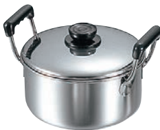
⑧MA 18-0 深型 ソースポット