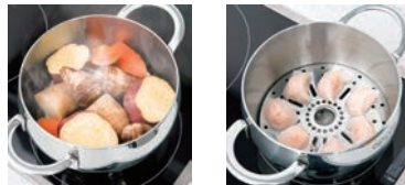
⑧スチームスタンド