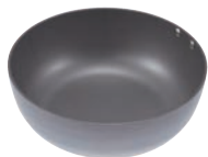
⑨ ココパン 鉄鍋