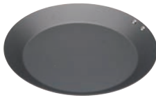
⑦ ココパン モーニング