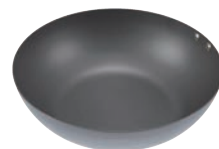
⑤ ココパン 炒め