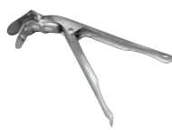
⑩ 18-8 パングリッパー