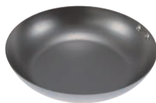
④ ココパン ベーシック