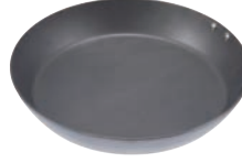
⑧ ココパン プレミアム