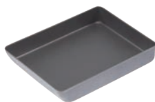
⑥ ココパン グリル