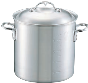
①ニューキング アルミ 寸胴鍋 (目盛付)