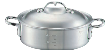
③ニューキング アルミ 外輪鍋 (目盛付)