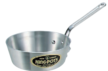
⑥ニューキング アルミ テーパー鍋 (目盛付)