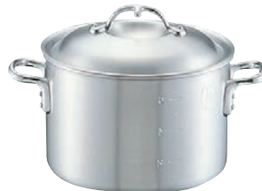
②ニューキング アルミ 半寸胴鍋 (目盛付)