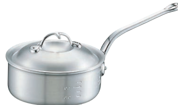
⑤ニューキング アルミ 浅型 片手鍋 (目盛付)