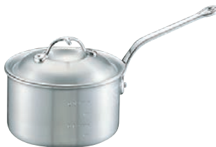
④ニューキング アルミ 深型 片手鍋 (目盛付)