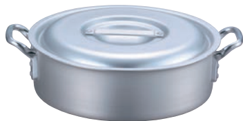
③EBM アルミ プロシェフ 外輪鍋