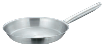
⑦マトファー／ブウジャ フライパン 6850