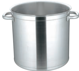
①マトファー／ブウジャ ストックポット 6840(蓋無)