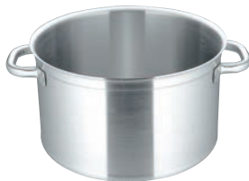
②マトファー／ブウジャ ソースポット 6800(蓋無)