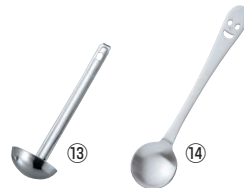
⑬18-8 レードルタイプ 計量スプーン