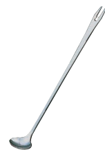
⑱18-8 ピアス 調味スプーン