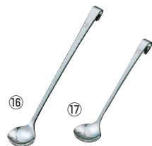
⑯18-8 パウダースプーン ロング