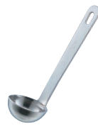
⑫18-8 極厚レードル 計量スプーン