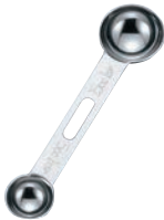
⑥パティシエール 18-8 計量スプーン PP-512 研