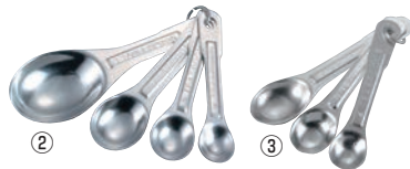
アルミ 計量スプーン