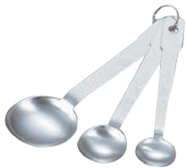
①パティシエール 18-8 計量スプーン PP-513 (3本組) 研