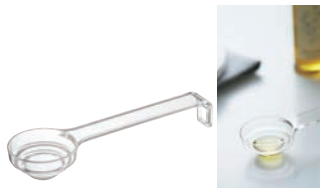
⑪段々計量スプーン レイヤー 2548 研