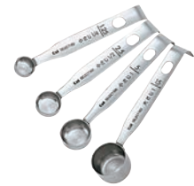
⑤18-8 計量スプーン DH-3006 研