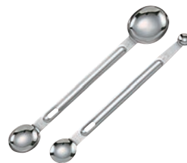
⑩ロング計量スプーンセット DH-7123 研