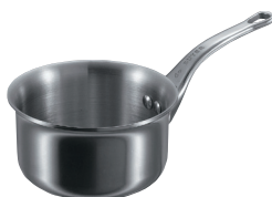
⑨ミニソースパン 3706 (蓋無)