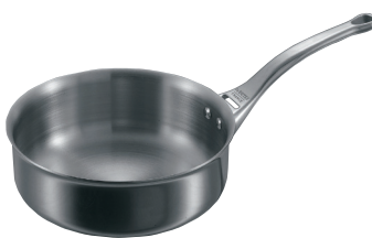
④ソテーパン 片手 3730 (蓋無)