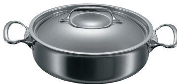
②ソテーパン 両手 3741 (蓋付)