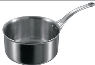
③ソースパン 3706 (蓋無)