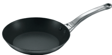
⑥フライパン 3718 ノンスティック