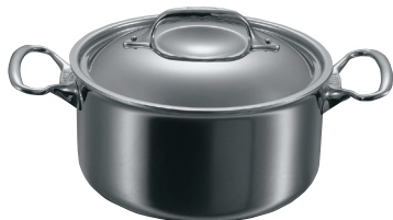
①シチューパン 3742 (蓋付)