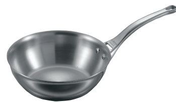
⑤コニカルソテーパン 3736