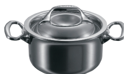
⑩ミニシチューパン 3742 (蓋付)