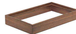
④9377910 ブラウン 530×325×H80 4062700 ¥20,000