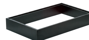
⑤9377911 ダークブラウン 530×325×H80 4062800 ¥17,000