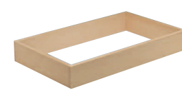
⑥シナリオ スタッキング用木枠 シェーンバルド 9377940 505×300×H72 4063300 ¥9,000

④又は⑤の木枠を積み上げる際、⑥を使用することで木枠のスレを防ぎ、安全に積み上げることができます。